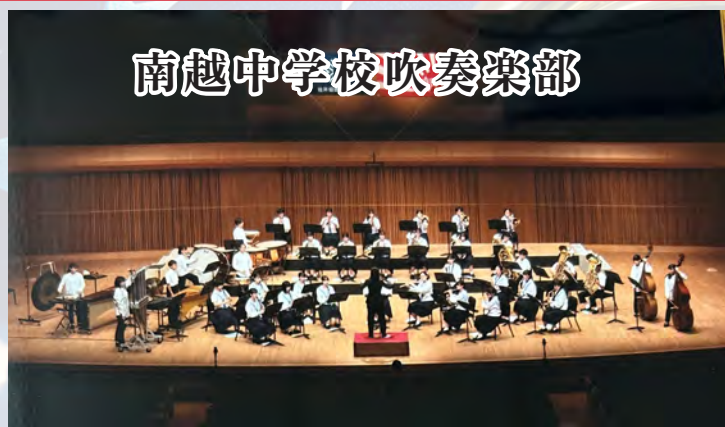
南越中学校吹奏楽部