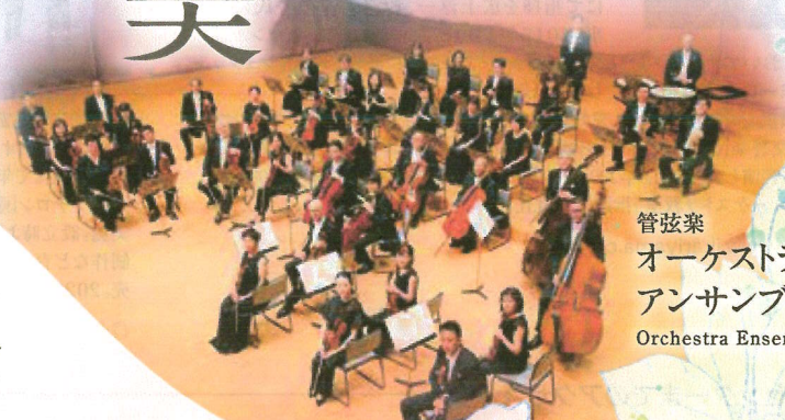
管弦楽 オーケストラ・ アンサンブル金沢 Orchestra Ensemble Kanazawa

PROGRAM ● ロマンズ ● 聖母たちのララバイ ● タッチ ● ごめんねDarling ●